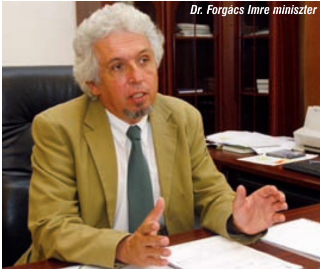
Dr. Forgács Imre miniszter

Egy tavaly megjelent Kormányrendelet-módosítás szerint 2010-től a Magyar Államkincstár (MÁK) veszi át a Rendőrség bérszámfejtését. Az átszervezés végrehajtására előreláthatóan 2010. márciusi időponttal kerül sor.