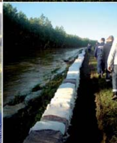
PERES ÜGYEINK ÖSSZEFOGLALÓJA 16. oldal