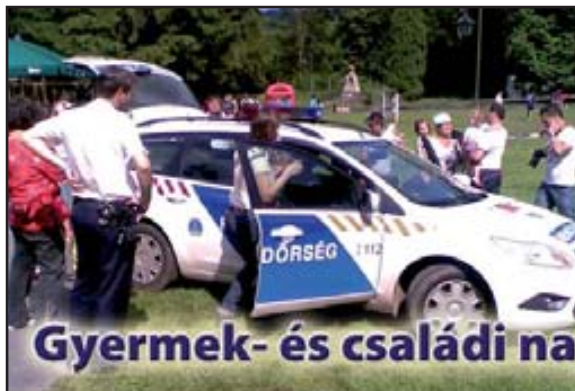
Gyermek- és családi nap - Horgászverseny