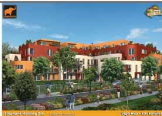
Elephant Holding Zrt. | Vigo Ház | XX. Kerület