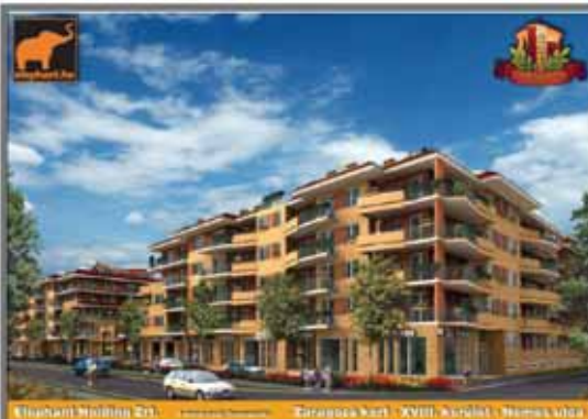
Elephant Holding Zrt. | Zaragoza Kert | XVIII. Kerület | Nemes utca