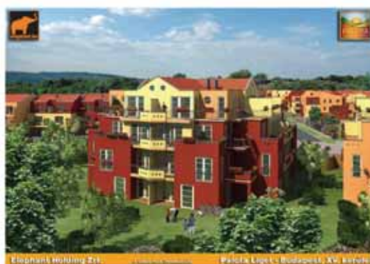
Elephant Holding Zrt. | Palóck Liget | Budapest, XV. kerület