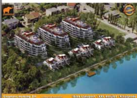
Elephant Holding Zrt. | Ibók Lakópark | XXI. Kerület | Kőröscsatorna