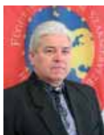
DR. ORBÁN VIKTOR úrnak! Magyar Köztársaság Miniszterelnöke Budapest