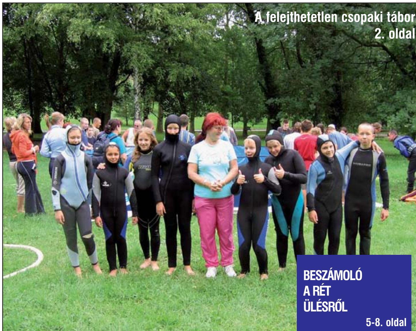
A felejthetetlen csopaki tábor 2. oldal