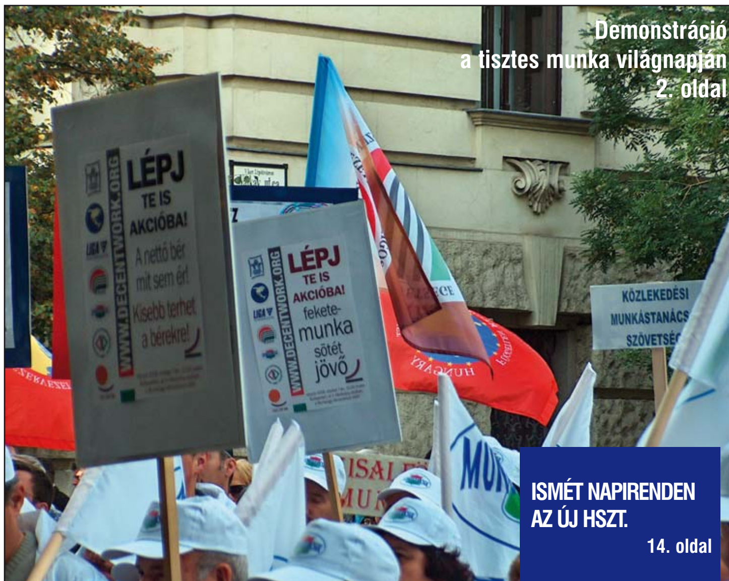
Demonstráció a tisztességes munka világnapján 2. oldal