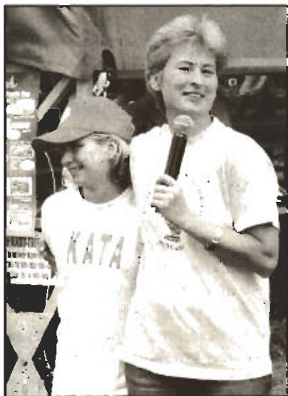
Kata lánya magyar Dzsúdóbajnok

lefonon néha beszélünk, de a személyes találkozásra tulajdonképpen csak ezek a régiós találkozók teremtenek alkalmat, ezért is találtuk ki.