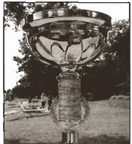
A focikupát a dombóváriak nyerték